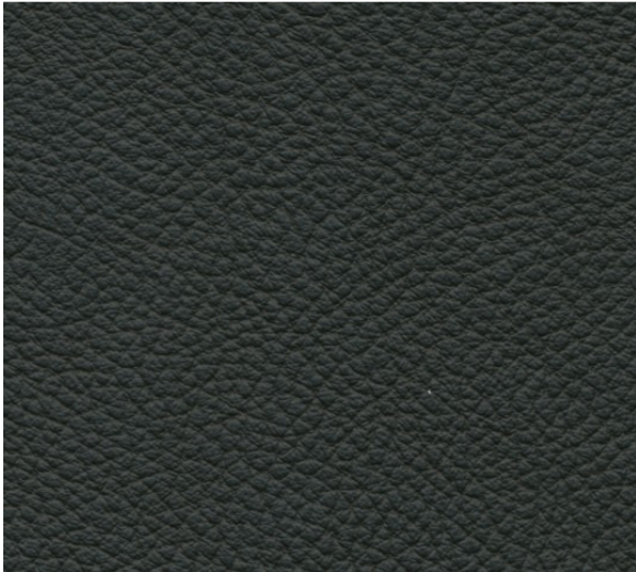
Loft Nappa-Leder, schwarz, von Bayern-Leder. Gut auch für die Rückenlehne in Kombination mit Railtex auf dem Sitz